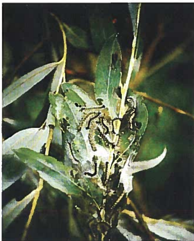
Larve di Hypurrhinia cunea

le larve, estremamente polifaghe, provocano defogliazioni a carico di numerose specie, prediligono il gelso e l'acero negundo (che sono i primi ad essere attaccati). Noce, pioppo, platano, salice, tiglio, sambuco sono frequentemente colpiti e, nel caso di gravi infestazioni, anche ippocastano ed olmo, diverse specie di frutteti e di arbusti ornamentali possono essere danneggiati. Danni occasionali e solitamente contenuti si possono inoltre verificare sul finire dell'estate, a carico di coltivi di erba medica, mais e soia, attigui ad alberate intensamente defogliate.