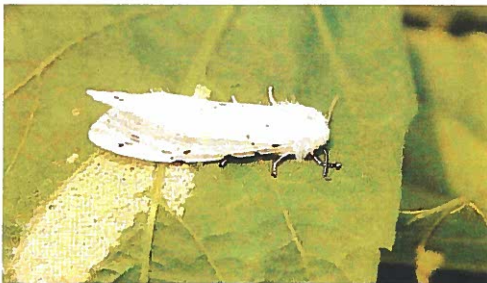
Adulto femmina di Hyphantria C. durante l'ovodeposizione.

I bruchi, raggiunta la maturità (in un mese circa) si mettono alla ricerca di adatti ricoveri: nel terreno, in un anfratto di tronco d'albero, in crepe nei muri, sotto le tegole delle abitazioni, per incrisalidarsi e svernare (larve della II generazione).